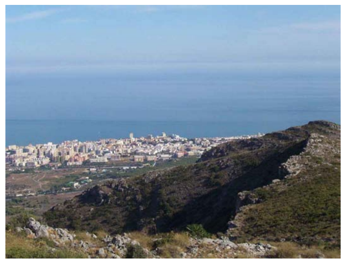
Tajo de La Paloma y Torremolinos

Durante el recorrido apreciaremos una vegetación de esparto, aulagas, palmito, cantueso, nazareno, manzanilla, coscojas y bosquetes de pino carrasco y resinero, donde habitan ejemplares de ardilla, meloncillos, erizos y la víbora hocicuda y, podremos observar el vuelo, del águila culebrera, cernícalos, perdices, etc.